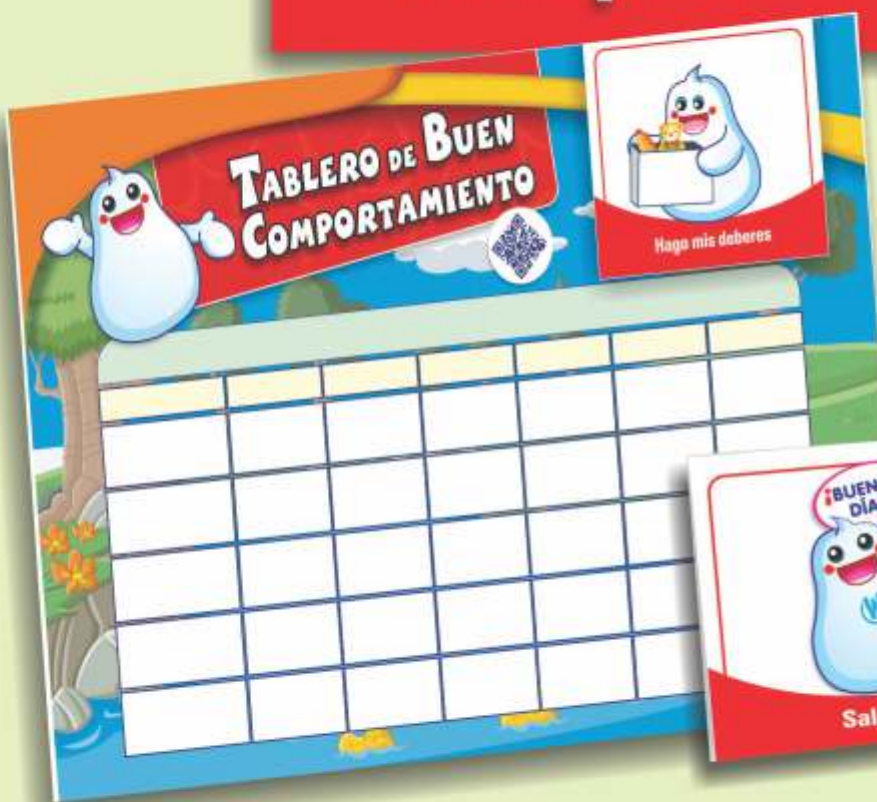
Tablero de buena conducta