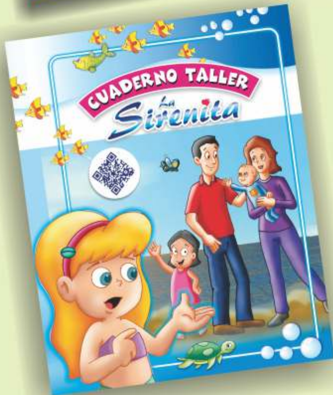
Cuaderno con talleres