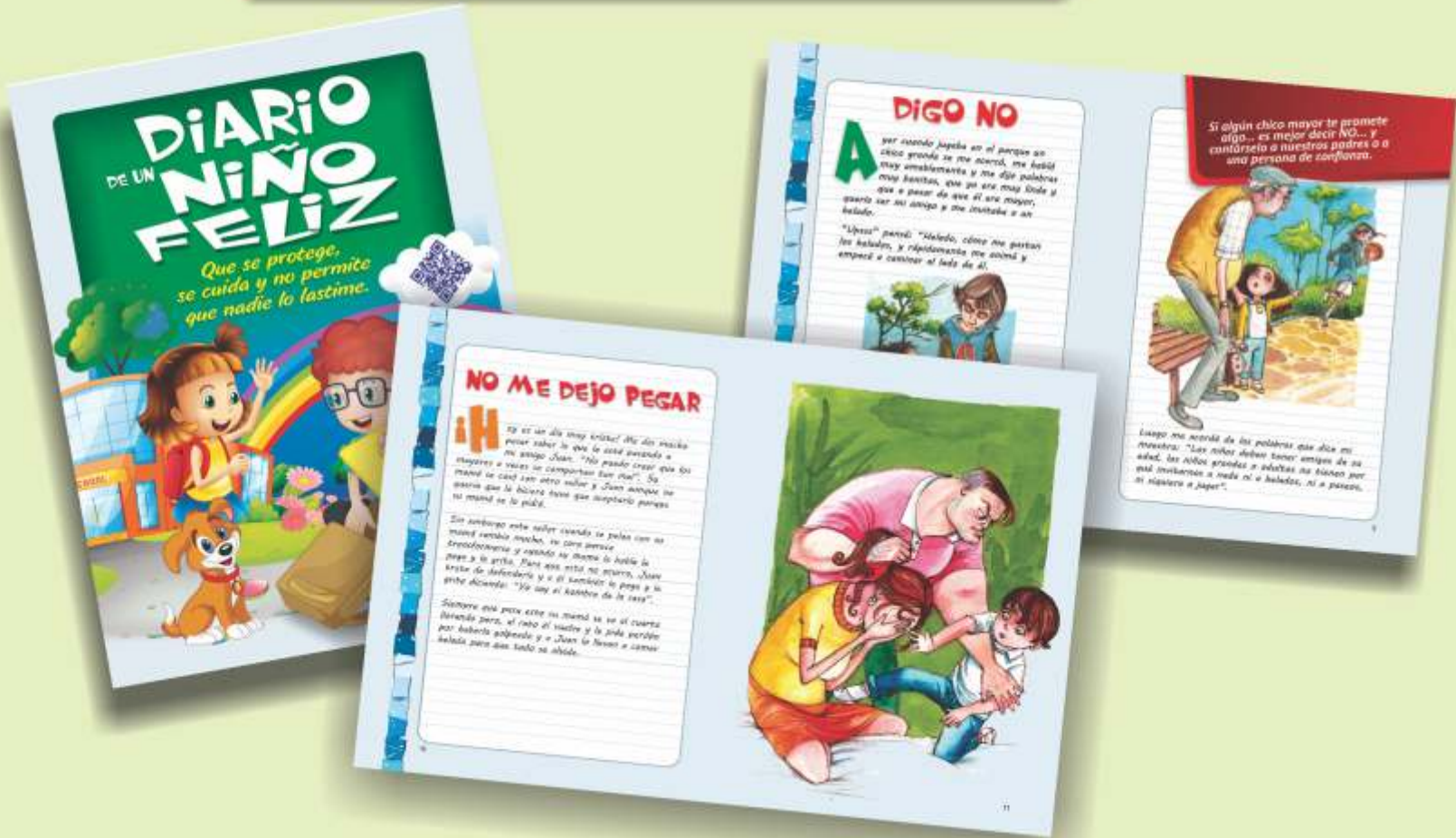
Cartilla con historias