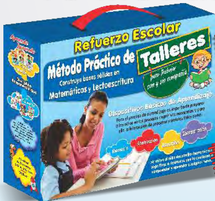
Estuche de lujo tipo Maletín